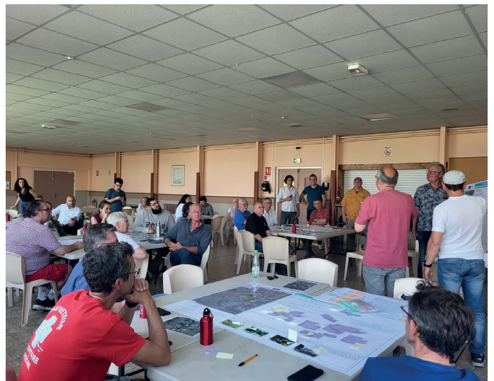
Photos prises par Ville Ouverte lors de la balade urbaine et de l'atelier sur table du samedi 10 juin 2023